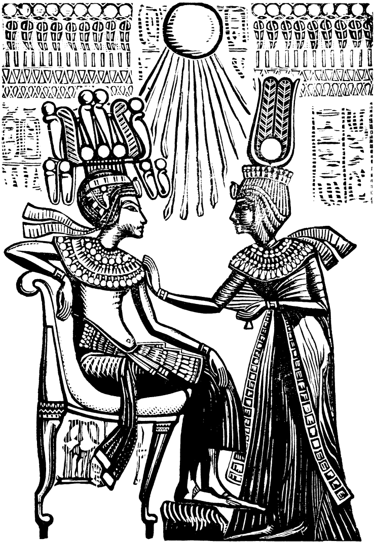
FIG. 12. — Toutankhamon et sa femme : la reine Ankhes reçoivent du Soleil les effluves de vie.

(Hypogée de Toutankhamon. Musée du Caire).