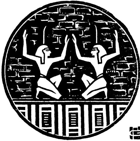
FIG. 96. — Deux initiés osiriens font monter la flamme de Vie.