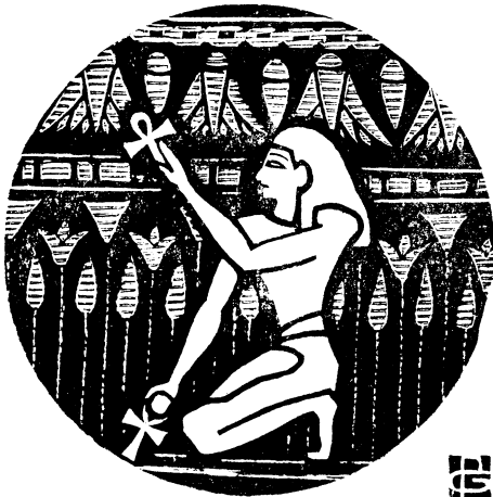
FIG. 97. — Initié osirien établissant un courant de Vie descendant et ascendant.