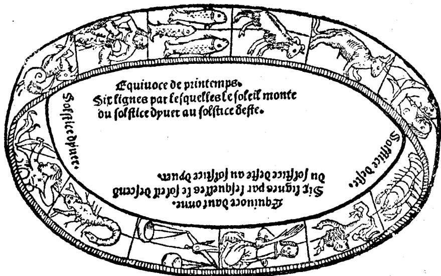
Les signes du Zodiaque correspondants à la succession des mois.

Croissant fin dont l'épaisseur va en augmentant jusqu'à for-